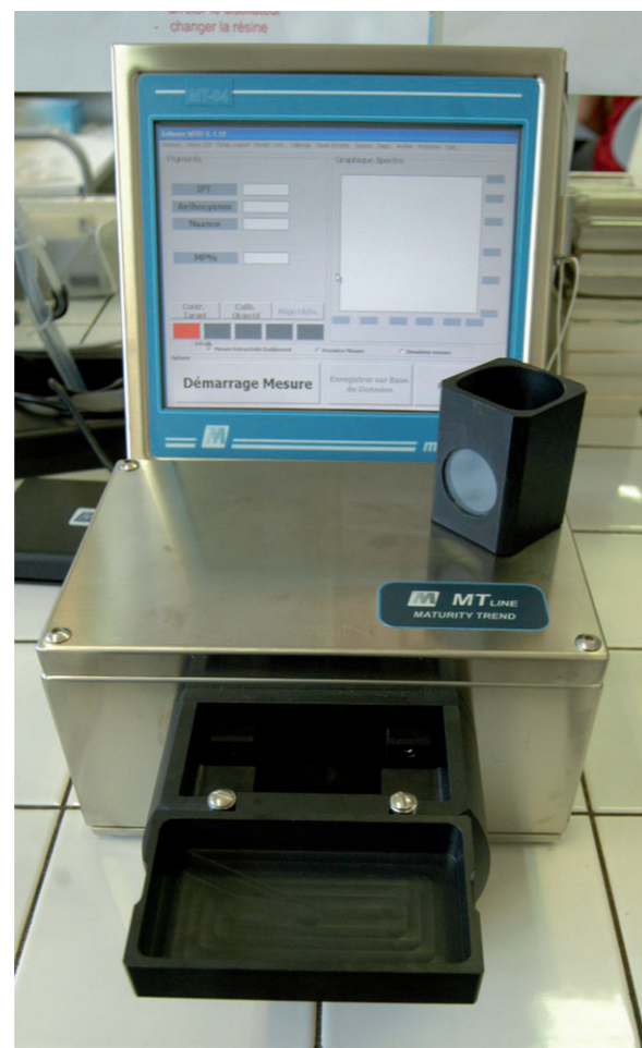
■ MT-01 de Maselli Misure, Source : IFV.

Comme dans le cas de la méthode CASV, l'étude de l'évolution des courbes données par les valeurs de