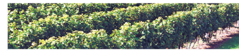
AVENIR AGRICOLE ET VITICOLE AQUITAINE - 3 SEPTEMBRE 2010

CONSEILS ET GESTION DE PROPRIÉTÉ TOUS TRAVAUX VITI-VINICOLES MANUELS ET MÉCANIQUES LOCATION DE MATÉRIEL (Entreprise qualifiée Quali Territoire) BP 80 - 33330 SAINT-EMILION TÉL : 05 57 55 38 00 - FAX 05 57 55 38 01 MÉDOC TÉL : 05 56 59 28 55 www.banton-lauret.com