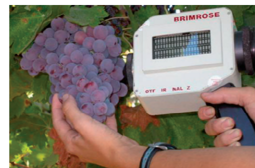
■ Luminar 5030 - Sté Isitec Sepal, Source : Isitec.

Un second équipement, de la société Isitec Lab, le «Luminar 5030», est également évalué dans les mêmes conditions et sur le même réseau de parcelles. Ce matériel est portable et permet de réaliser par spectroscopie dans le proche infra rouge des analyses non destructives sur grappes de raisins directement sur le terrain à la parcelle. Il est proposé pour pouvoir déterminer un certain nombre de paramètres : AT, pH, teneurs en sucres, Titre Alcoométrique Potentiel, teneurs en anthocyanes et azote assimilable.