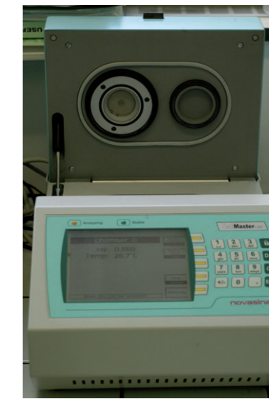
■ Awmètre Labmaster de la Sté Novasina

En 2009, sur chaque parcelle étudiée (merlot, cabernet franc et cabernet sauvignon) appartenant au réseau, un prélèvement hebdomadaire de 10 fractions de grappes de 10 baies est réalisé sur le rang de contrôle pour réaliser la mesure d'Aw. Un prélèvement hebdomadaire de 200 baies est également effectué et envoyé au laboratoire d'analyse pour le suivi analytique des paramètres propres à l'avancement de la maturité des baies de raisin (à savoir AT, pH, Anthocyanes par la méthode CASV, sucres et TAP). Ces valeurs sont nécessaires au modèle de détermination de l'IPP. La mesure de l'Aw est effectuée grâce à l'Awmètre de chez Novasina. Il est nécessaire d'obtenir 5 à