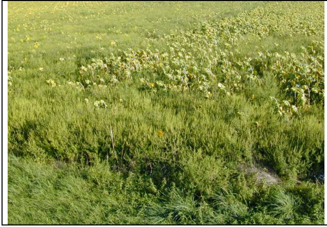
Photo 1. Ambrosia artemisiifolia dans la Nièvre (58) : Dans une parcelle à stock semencier historiquement important, très forte infestation mal anticipée sur tournesol présentant de surcroît de gros problèmes de levée