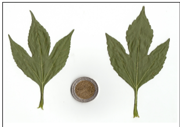
Photo 4. Ambrosie trifide Feuille de 3 à 5 lobes en éventail