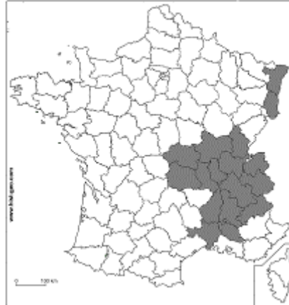
Figure 1 - Carte des départements disposant d'un arrêté de lutte contre l'Ambroisie à feuilles d'armoise; au titre de la santé publique.

Ces arrêtés obligent la destruction de l'ambroisie (si possible par des méthodes non chimiques) à des dates comprises entre le 1er Juillet et le 15 Août. Les gestionnaires (propriétaires, locataires, exploitants, maîtres d'ouvrage...) de tous types de milieux publics ou privés (parcelles agricoles, chantiers, bords de route...) sont tenus d'intervenir et en cas de défaillance, les contrevenants sont passibles de poursuites.