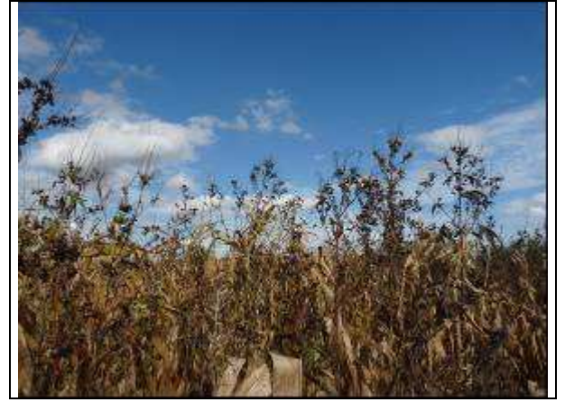
Figure 2. Ambrosia trifida dans une cultures de Maïs Ariège (09) : une géante à apprendre à identifier