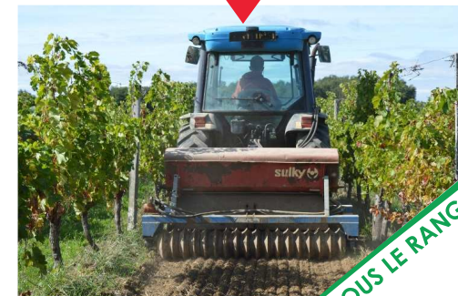
SOUS LE RANG