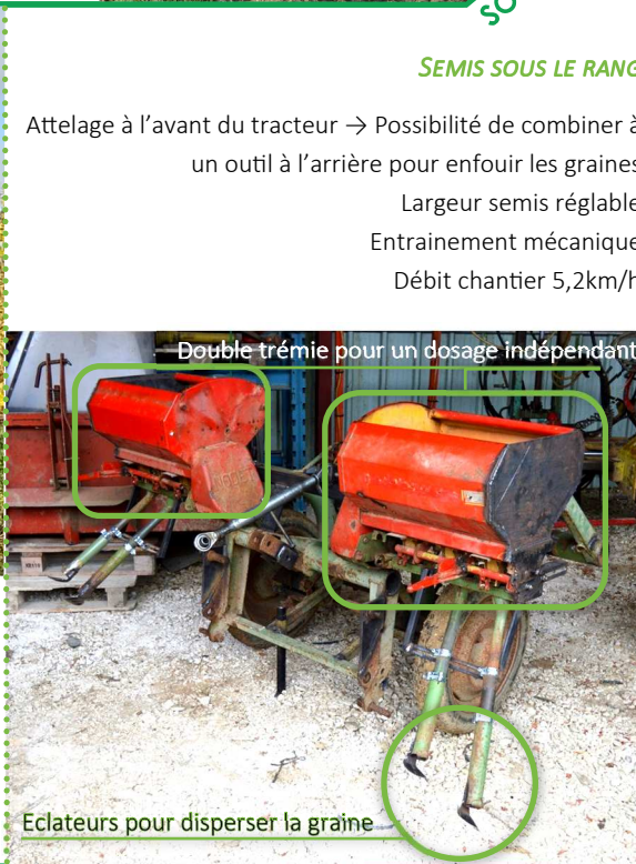
SEMIS SOUS LE RANG

Déplacement hydraulique Débit chantier 4 km/ha (2/an)